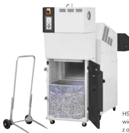
HSM SP 4040 V: widok od tyłu z otwartymi drzwiami