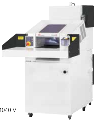
HSM SP 4040 V