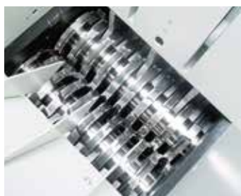
1. stopień mechanizmu tnącego: rozdrabniacz wstępny