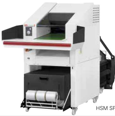
HSM SP 5088