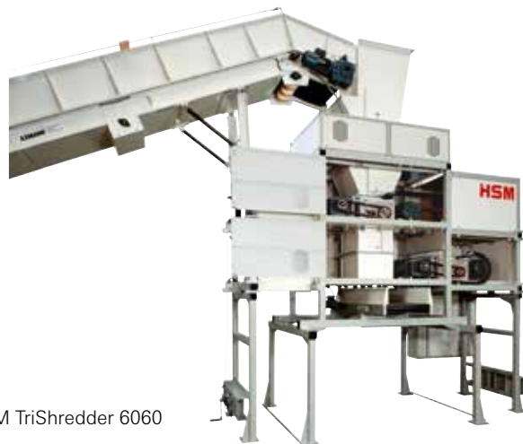
HSM TriShredder 6060