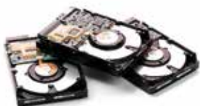
Niszczenie dysków twardych

Wiele z nich jest utylizowanych w bardzo lekkomyślny sposób; są sprzedawane na różnych wyprzedażach czy aukcjach internetowych, a znajdujące się na nich dane są wcześniej zazwyczaj tylko kasowane. Stanowi to otwarte zaproszenie do nadużyć; nieprawidłowo usunięte dane, hasła czy konta można z łatwością przywrócić i odtworzyć.