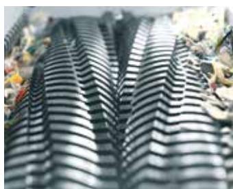
2. stopień mechanizmu tnącego: rozdrabniacz zasadniczy