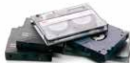
Niszczenie taśm magnetycznych