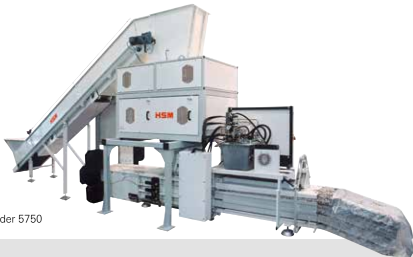
HSM DuoShredder 5750