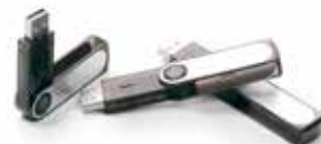
Niszczenie pamięci USB