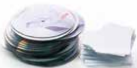
Niszczenie płyt CD, DVD i Blu-ray, kart plastikowych